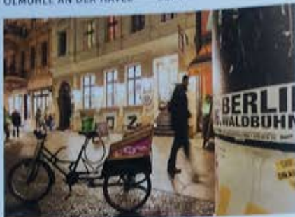
Das kleine Laden liegt in einer belebten kreuzberger Fußgängerzone