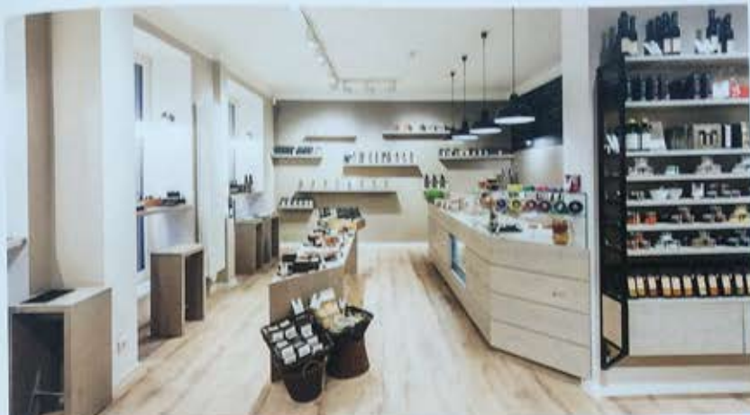
Der Interieur aus hellem Holz wird von wenigen dunklen Kontrasten akzentuiert.