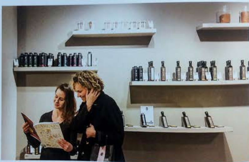
Übersichtlichkeit und präzise Gestaltung prägen die Räume.